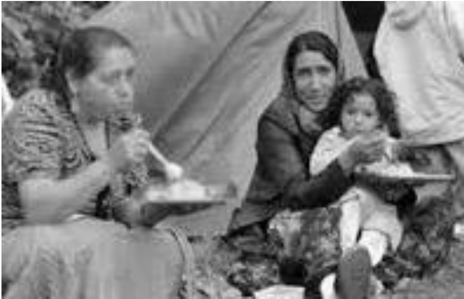
Fig. 3. Les Etats doivent veiller à la fourniture d'eau potable pour les enfants (Convention sur les droits des enfants, art. 24)). Cette obligation de droit international N'est pas toujours respectée en France. Il y a beaucoup d'enfants dans les bidonvilles.

considéré que le coût des points d'eau et des latrines était très élevé et a décidé de l'imputer à l'Etat. Le Conseil d'Etat saisi en appel a confirmé cette décision.