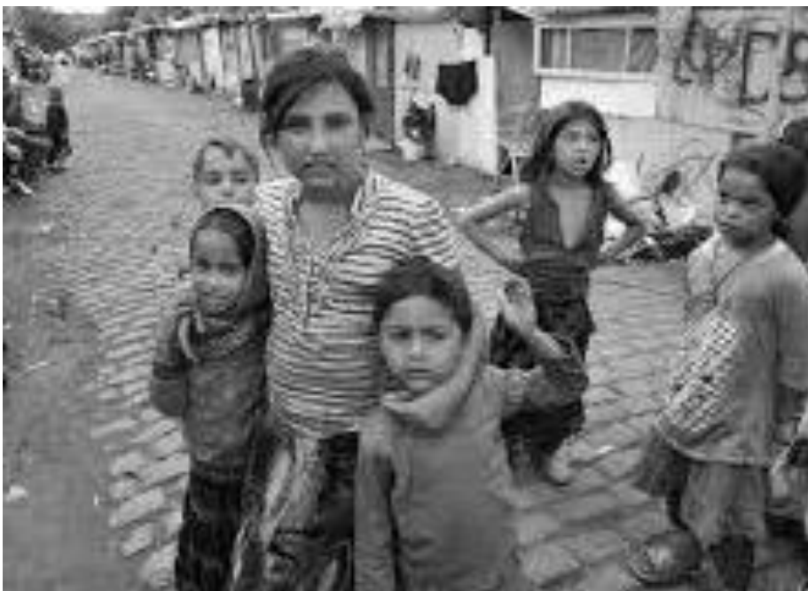
Fig.2. Une rue dans un bidonville

En 2020, le Val d'Oise (1.2 million d'habitants) compte 26 campements qui abritent une population estimée à 1 231 personnes dont 420 mineurs. Les conditions de vie y sont très pénibles puisque plus de 50% de ces campements ne disposent pas d'un accès immédiat à l'eau. Le 31 mars 2020, le Préfet du Val d'Oise a adressé une lettre aux maires concernant l'accompagnement des personnes vulnérables dans les campements, les bidonvilles et les aires d'accueil des gens du voyage. Il rappelait notamment que « outre la mobilisation des services de l'Etat et des acteurs associatifs, l'intervention des collectivités locales est fondamentale pour assurer la protection de ces publics et garantir la satisfaction des besoins humanitaires essentiels, c'est à dire l'accès à l'eau potable , l'alimentation et le cas échéant l'accès aux soins ». Le Préfet a demandé aux maires « de tout mettre en œuvre afin de permettre à ces populations d'accéder à l'eau, y compris par l'installation de citernes si besoin »